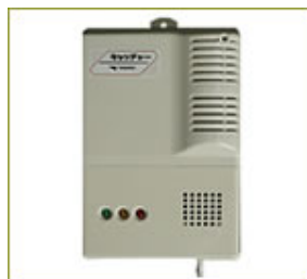
CO（一酸化炭素）検知機能付警報機